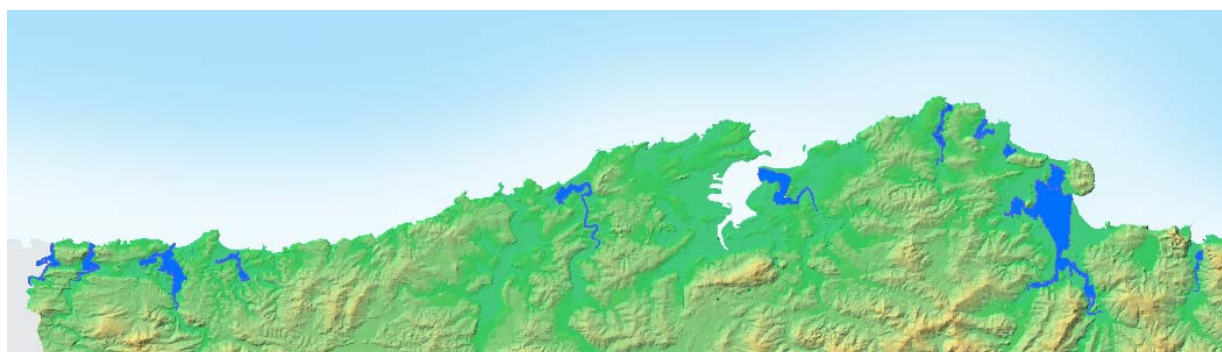
Figura A.2. Masas de agua de transición (DMA) localizadas en espacios de la red Natura 2000 en Cantabria.

Esta tipología integra el conjunto de espacios definidos como masas de agua de transición, en el marco de la Directiva Marco del Agua (Figura A.2).