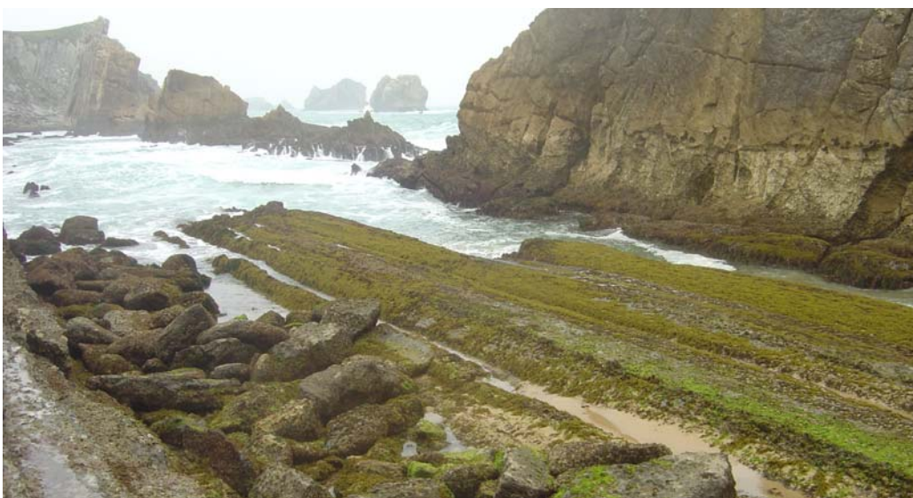
Figura A.5. Ejemplo del espacio integrado en la tipología ecológica Sistema rocoso costero.

Esta tipología integra todas aquellas zonas costeras intermareales de sustrato rocoso, en las que se desarrollan hábitats marinos listados en la Directiva.