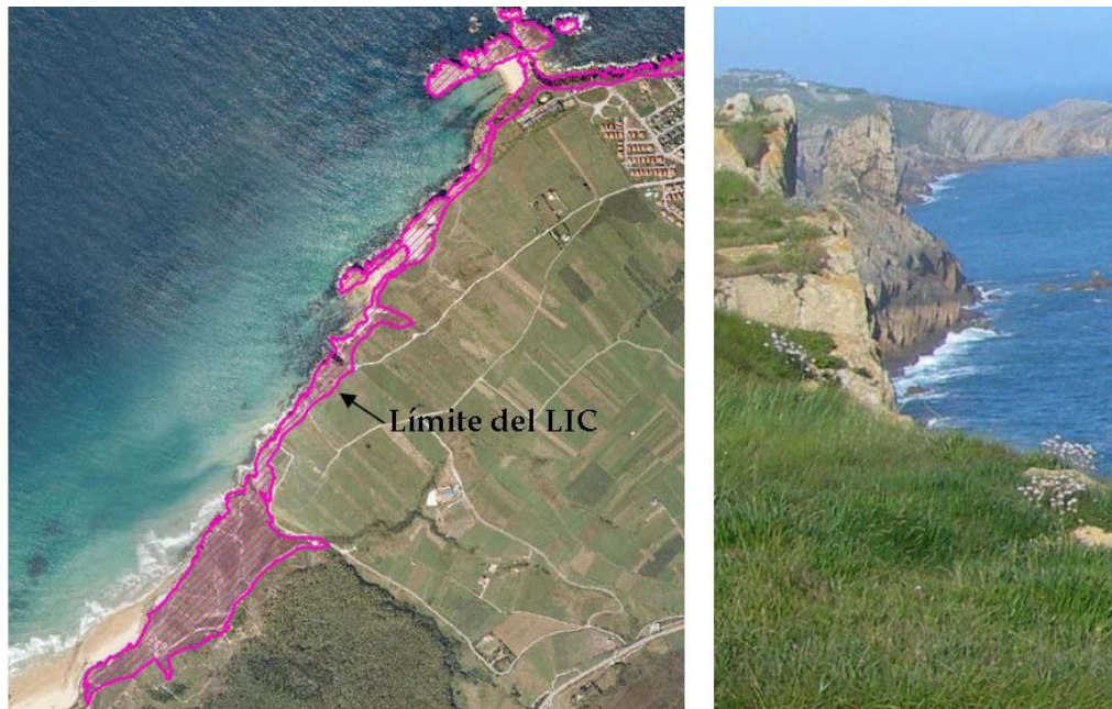
Figura A.4. Ejemplo de la delimitación de la tipología ecológica Acantilado y rasa litoral en el LIC Dunas de Liencres y Estuario del Pas.

del propio espacio Natura (Figura A.4), bien con el límite de otra tipología ecológica litoral propia del medio terrestre, tal como el Bosque litoral.