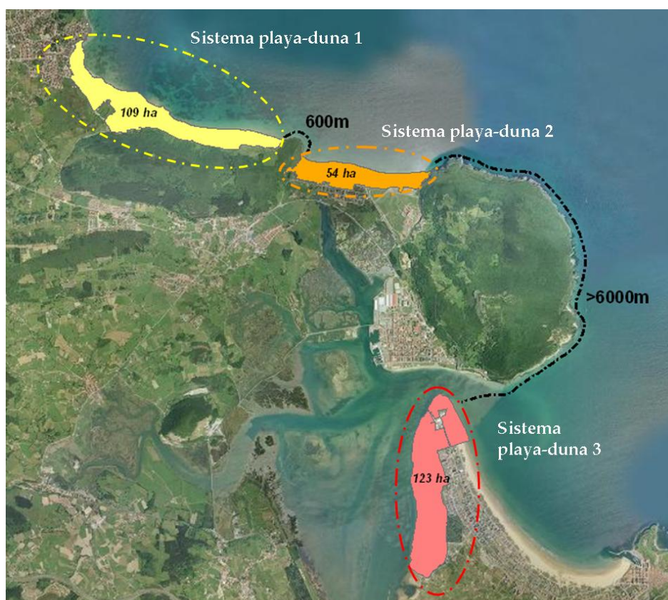
Figura A.7. Ejemplo de la segmentación de la tipología Sistema playa-duna del LIC Marismas de Santoña, Victoria y Joyel en unidades de valoración.

De este modo, se consideran unidades de valoración diferenciadas aquellos espacios geográficos de la misma tipología que se encuentran separados una distancia de, al menos, 500 metros y presentan un área mínima de una hectárea (Figura A.7).