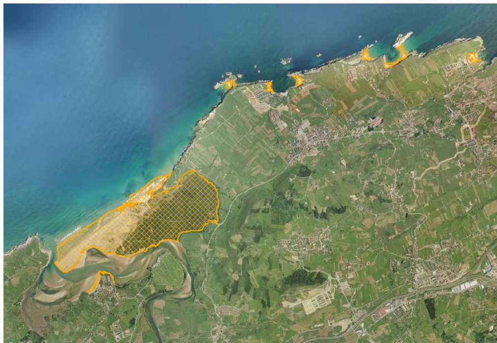
Figura A.1. Ejemplo de delimitación de la tipología ecológica sistema playa-duna en el LIC Dunas de Liencres y Estuario del Pas.