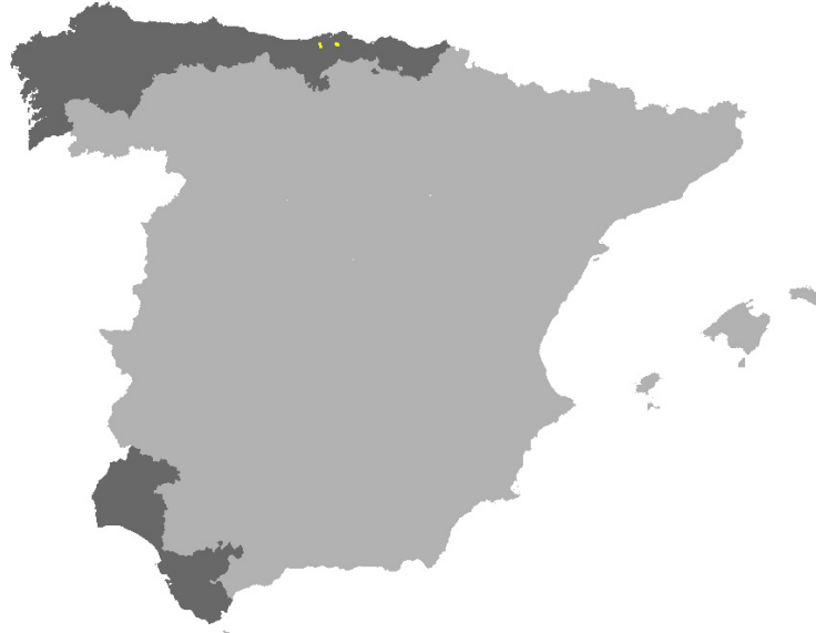
Figura I.34. Distribución del hábitat 3270 en los LICs acuáticos de Cantabria y en la red Natura 2000 de las provincias de la Región Biogeográfica Atlántica de la Península Ibérica.