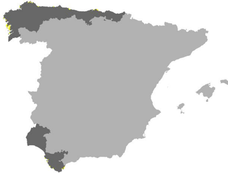
Figura I.12. Distribución del hábitat 1210 en la red Natura 2000 de las provincias de la Región Biogeográfica Atlántica de la Península Ibérica.