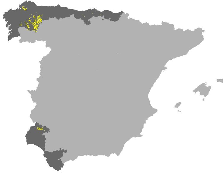
Figura I.42. Distribución del hábitat 9260 en los LICs acuáticos de Cantabria y en la red Natura 2000 de las provincias de la Región Biogeográfica Atlántica de la Península Ibérica (Fuente: MMARM, 2009).