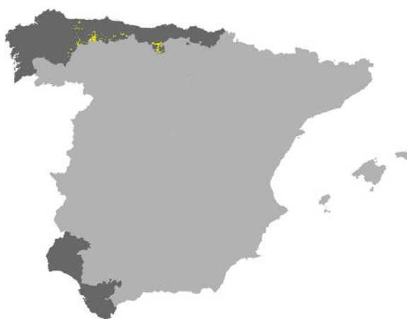
Figura I.24. Distribución del hábitat 6510 en la red Natura 2000 de las provincias de la Región Biogeográfica Atlántica de la Península Ibérica (Fuente: MMARM, 2009).