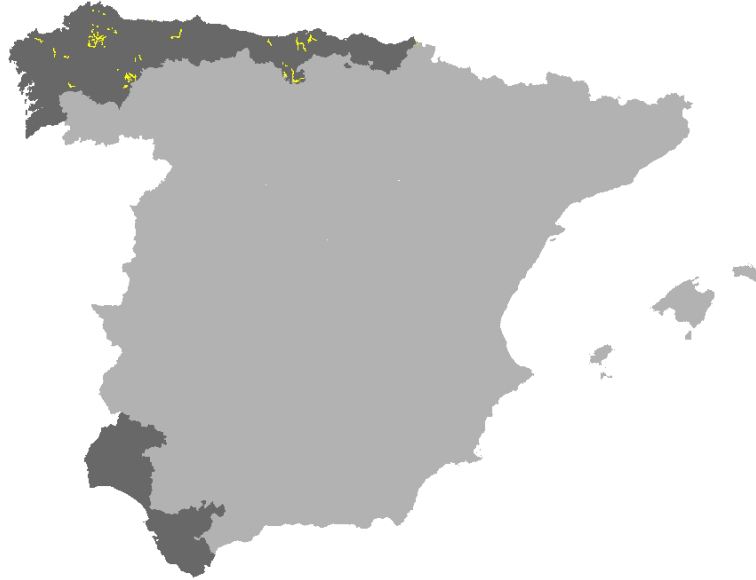
Figura I.8. Distribución del hábitat 3260 en la red Natura 2000 de las provincias de la Región Biogeográfica Atlántica de la Península Ibérica (Fuente: MMARM, 2009).