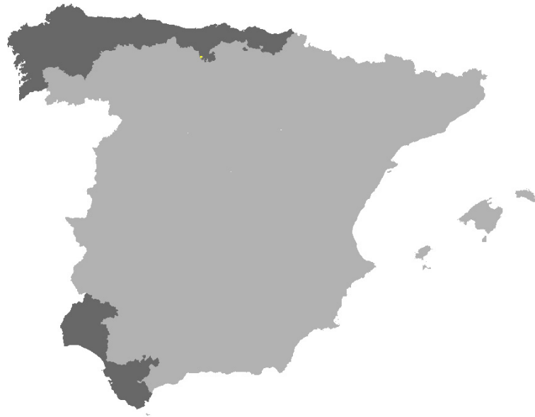
Figura I.6. Distribución del hábitat 3130 en la red Natura 2000 de las provincias de la Región Biogeográfica Atlántica de la Península Ibérica.